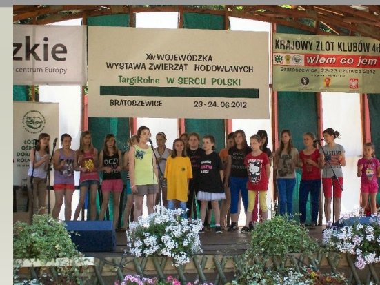
Aktywnie działamy w Klubie 4H.