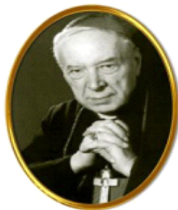
Patron szkoły - Prymas Tysiąclecia

„[...] szybujcie wysoko ku przyszości Ojczyzny i Kościoła [...]” - słowa te wypowiedziane przez Stefana kardynała Wyszyńskiego, stały się hasłem przewodnim uroczystości nadania naszej szkole imienia Prymasa Tysiąclecia.